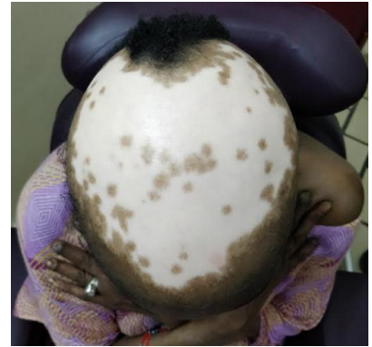
Figure 2 : Lésions achromiques, alopéciantes du cuir chevelu

Les données biologiques et radiologiques sont rapportées dans le Tableau II .