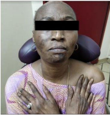
Figure 1 : Acrosclérose amputation digitale, macules érythémato-squameuses et atrophiques au niveau du visage

d'insuffisance mitrale 4/6 et d'insuffisance aortique 3/6 dans un contexte de sepsis.